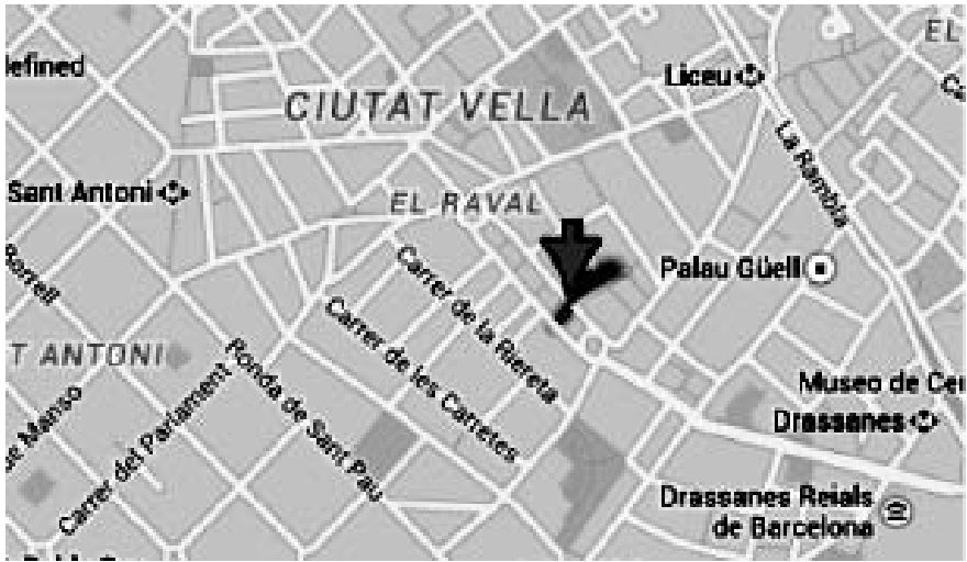
La flecha señala el espacio que ocupaba la calle Sant Antoni de Pàdua en lo que hoy es la Rambla del Raval