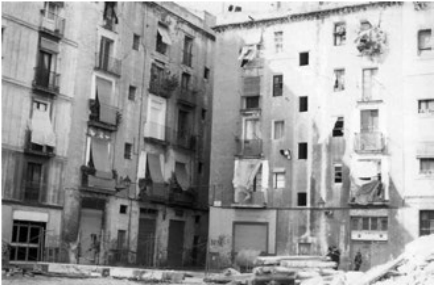
A la derecha, la calle de San Antonio de Padua; a la izquierda, la de San Jerónimo