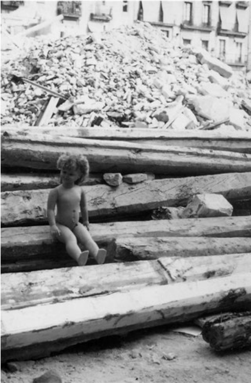
Las ruinas de la calle San Antonio de Padua