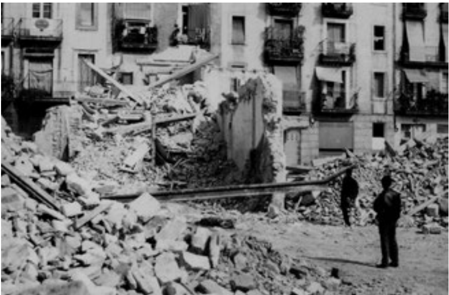
Restos del n. 7 de S. Antonio de Padua